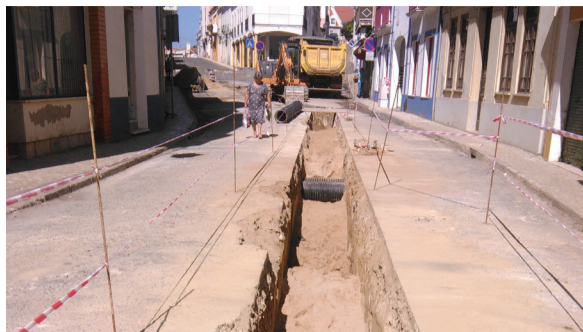
Cercal - Intervenção na Rua Teófilo Braga

✓ Melhorámos as condições da estrada municipal 553, em S. Domingos, contribuindo para facilitar a circulação automóvel e para promover a segurança rodoviária.