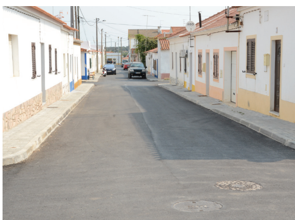
Alvalade - Reabilitação da Rua Catarina Eufémia