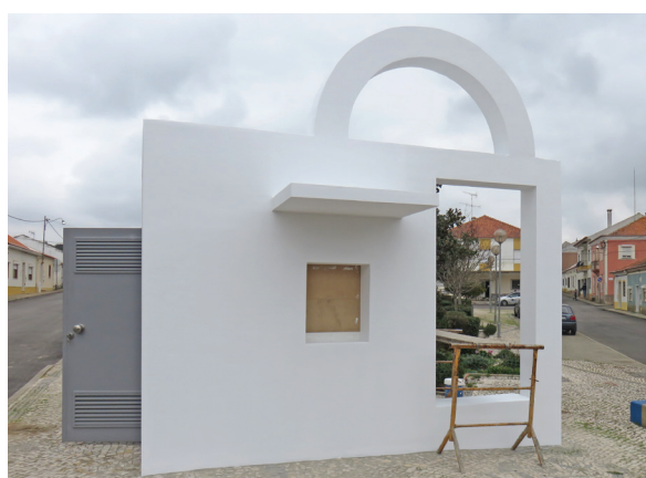
Abela Instalação de Multibanco