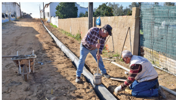
Ermidas - Requalificação da zona Este

✓ Criámos novas acessibilidades rodoviárias em Santiago do Cacém, através da ligação da rotunda da rua de Lisboa ao Campo Municipal Alternativo e à rua de S. Sebastião.