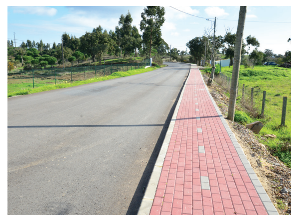
São Francisco da Serra Requalificação da Estrada Municipal 544